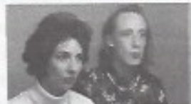
Le double, le doute, les plantes vertes