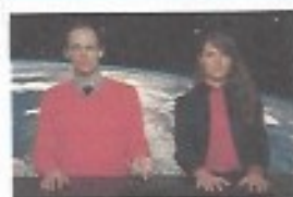
Sauver Gala avec des roques